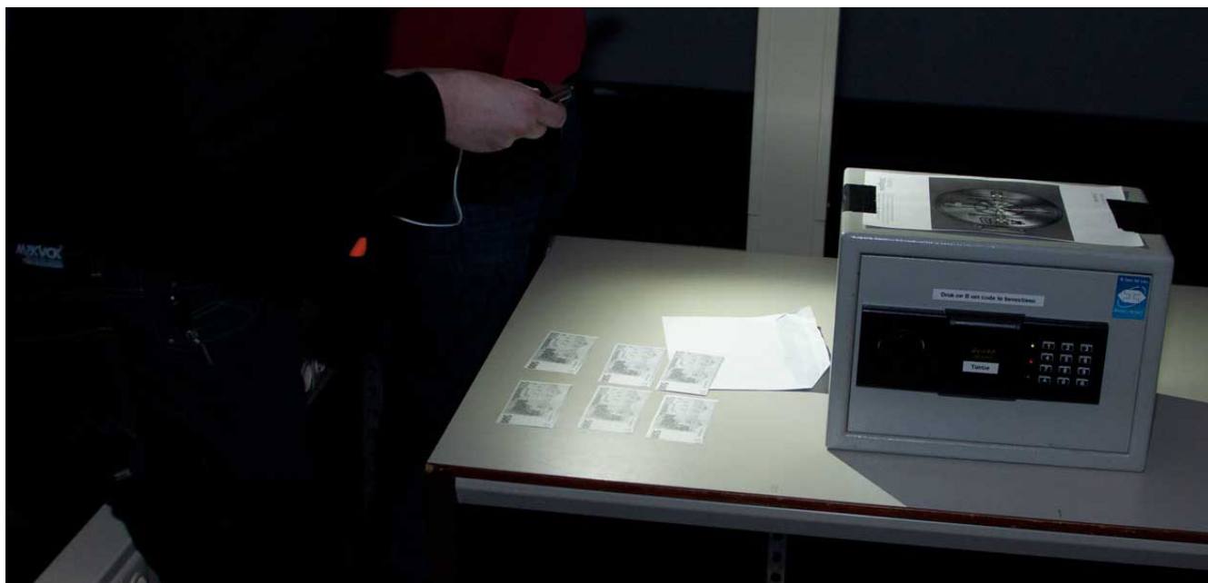
De snelste externe partij, team Rolstoelstruik, met een deel van het fortuin.